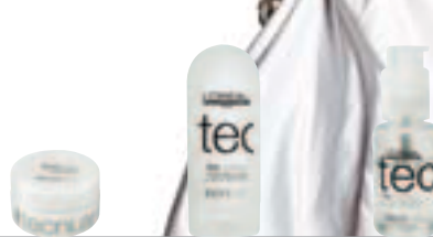
gloss wax Glanswax met versteviging