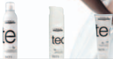
air fix Fixatiespray