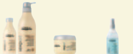
Shampoo 250/500 ml Dagelijkse reiniging. Masker 200 ml Intensieve verzorging 2 keer per week. Hydra Repair Spray 150 ml Kuur van 8-10 behandelingen voor intens herstel.