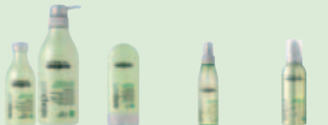
Shampoo 250/500 ml Dagelijkse reiniging. Crème 150 ml Aanvullende dagelijkse verzorging. Spray 150 ml Aanvullende dagelijkse verzorging. Mousse 150 ml Aanvullende dagelijkse verzorging met versleviging.

Voor prachtig haar vol volume vraagt u naar Volume Extreme van Série Expert!