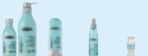
Shampoo 250/500 ml Dagelijkse reiniging. Crème 150 ml Aanvullende dagelijkse verzorging. Spray 150 ml Aanvullende dagelijkse verzorging. Powerdose Curl Intensieve verzorging voor gekruld haar.

Vraag in uw salon naar de powerdose curl, een intensieve verzorgende boost voor perfect gedefinieerde krullen die ultiem glanzen!